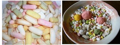
名古屋のひなあられ 全国で一般的

名古屋では円柱形と丸形のひなあられが一般的ですが、全国的にはひなあられと言えば丸いものなのか。